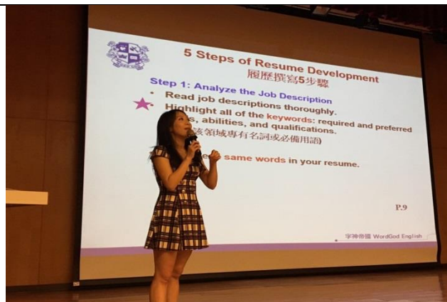
洪欣老師再次提醒重點